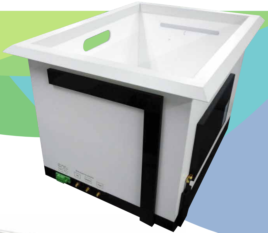
[ Side ]