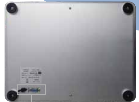
[ 하단 ]