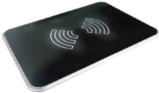
[ 하단 ]